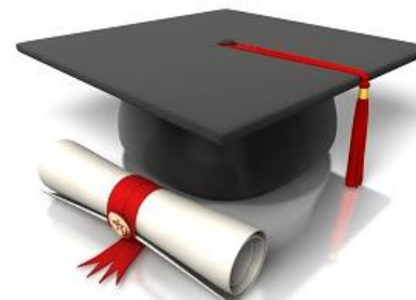
Получать профильное образование