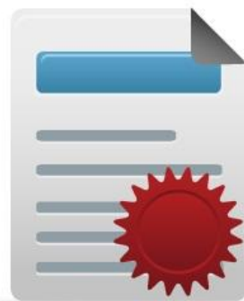
Получать лицензии и сертификаты